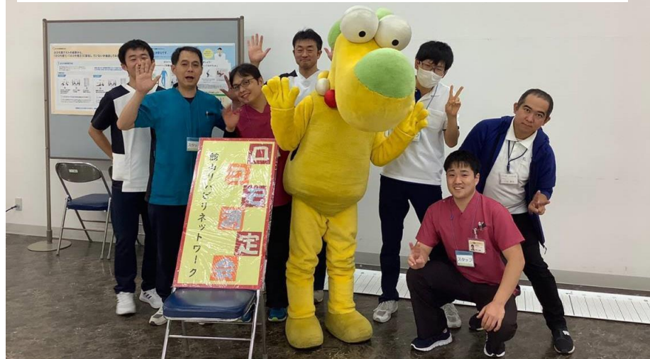
健脚道場 | たてやまかいごフェスタに出展